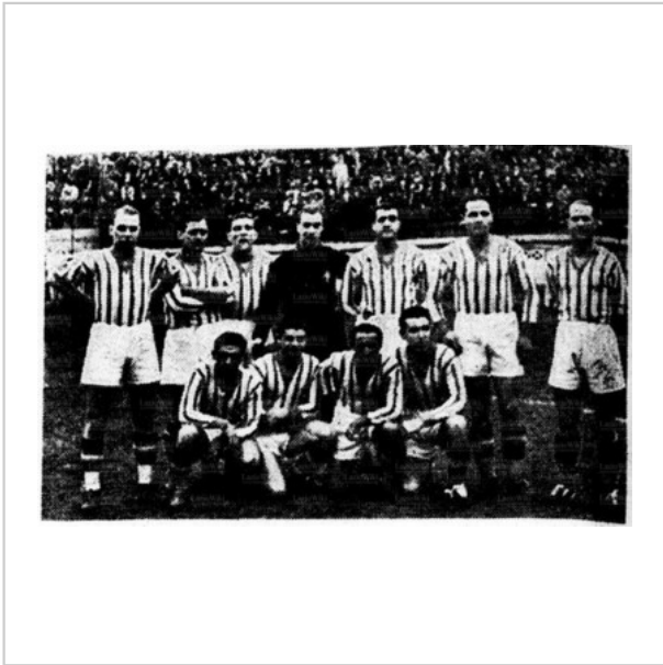
La formazione laziale